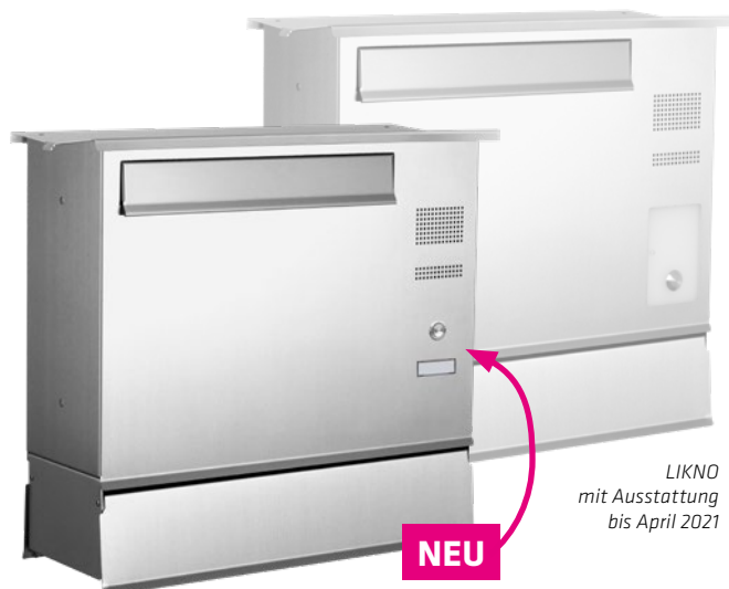
LIKNO mit Ausstattung bis April 2021

Mit Verkaufsstart des neuen LIKNOs wird es einen neuen Katalog mit passender Preisliste geben.