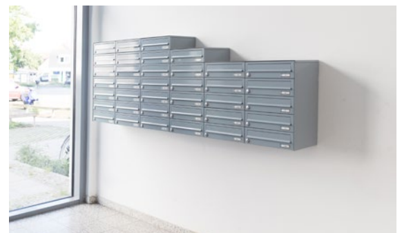
Aufputz-Briefkastenanlage mit Briefkästen in Bedienhöhe für Rollstuhlfahrer

www.max-knobloch.com | Service-Hotline: +49 3431 6064-200