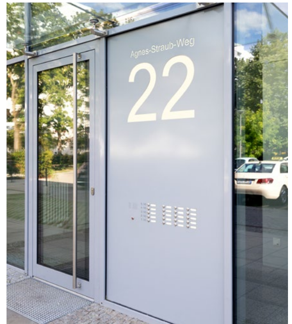
Türseitenteil-Anlage mit Klingeln in rollstuhlgerechter Höhe