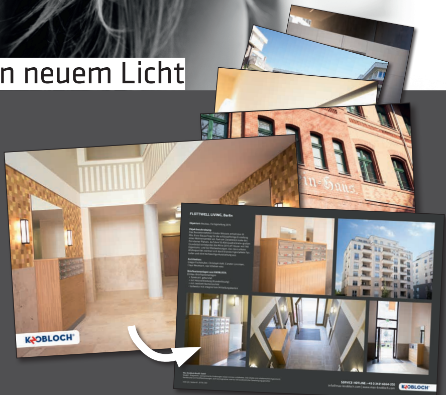
Rückseite mit Beschreibung, Detailsichten und Objektimpressionen

Psscht... die Marketing-Abteilung von KNOBLOCH arbeitet auch gerade schon an der Online-Präsentation der Sedcards in Form einer Architekten-Area. Dazu bald mehr.