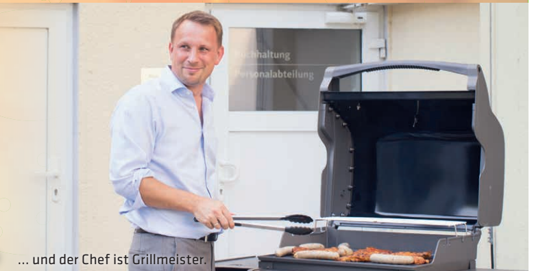
... und der Chef ist Grillmeister.