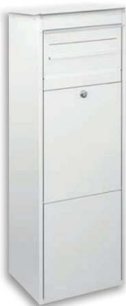
S7000-WE RAL 9016 Verkehrsweiß