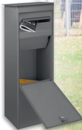
S7000-GA RAL 9007 Graualuminium