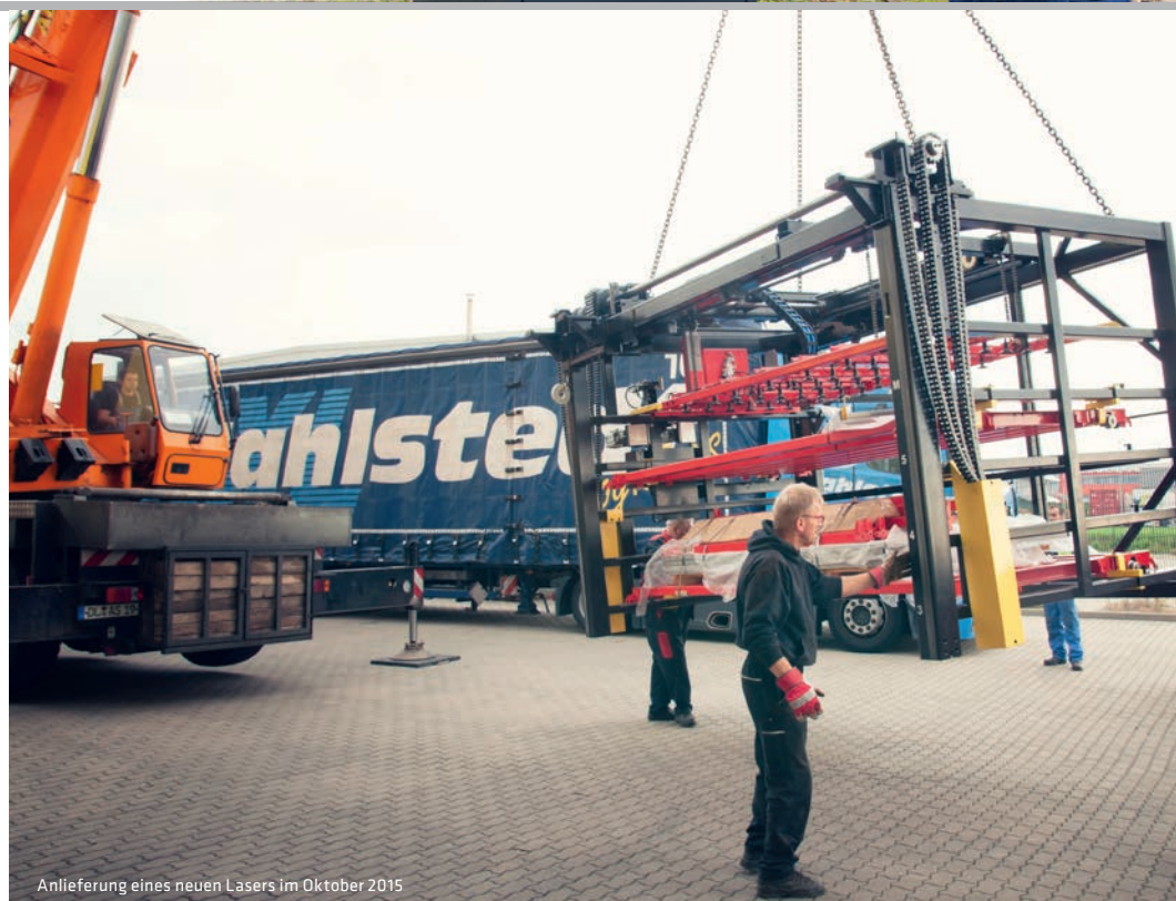
Anlieferung eines neuen Lasers im Oktober 2015

Wir sind schon ganz gespannt. Begleiten Sie uns!