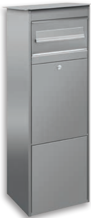
D7000 Edelstahl, gebürstet